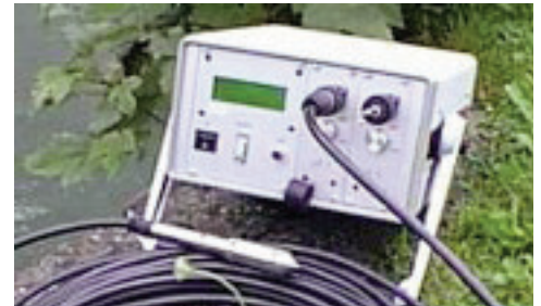
LLF-M with 2 signal channels