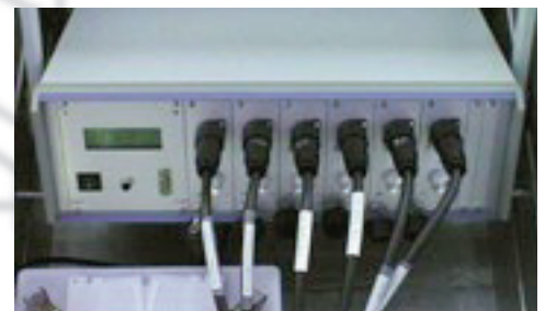
LLF-M with 6 signal channels